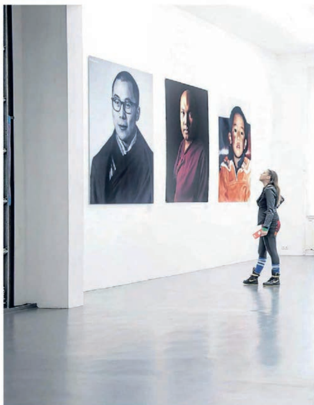
Tulkus in het centrum Witte de With